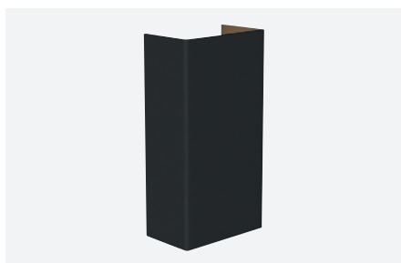
ID971001NST (gestructureerd zwart)