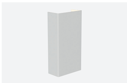
ID971000BST (gestructureerd wit)