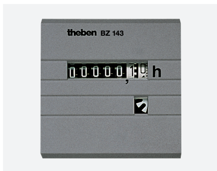
BZ143-1 230V 50HZ