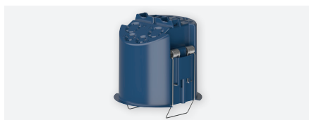
907.0.992, boîtier de montage au plafond 68A