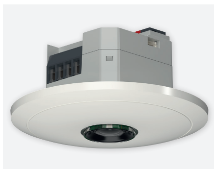
thePixa P360 KNX UP WH