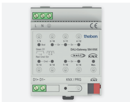
DALI Gateway S64 KNX