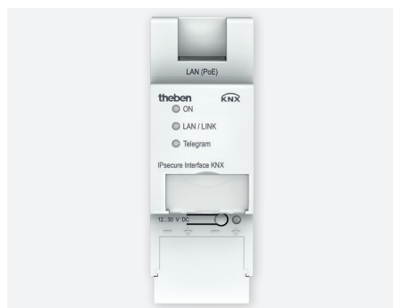
IP secure-Interface KNX