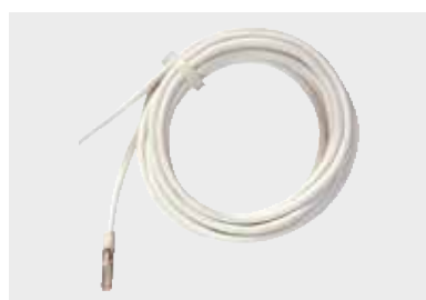
Sensor voor vloertemperatuur 907.0.321