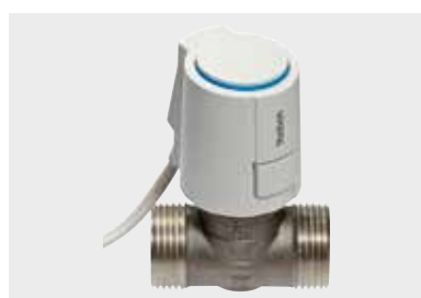
Servomoteur ALPHAS 230V