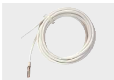
Capteur de température sol 907.0.321