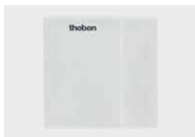
Sonde de température 907.0.459