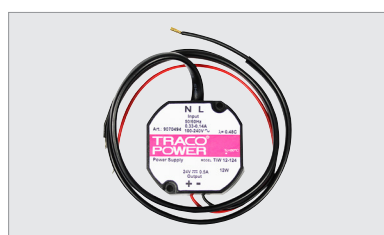
907.0.494, bloc d'alimentation pour montage encastré 24 V/12 W