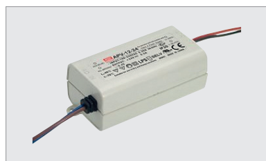
APV-12-24, alimentation 230 V AC - 24 V DC, 12 W