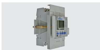
907.0.001, kit pour montage encastré

Le boîtier de commande Theben TC649 E permet de programmer les applications individuelles directement via le réseau LAN. La connexion s'effectue via le réseau LAN interne de l'entreprise, permettant ainsi de respecter toutes les exigences de sécurité du réseau LAN.