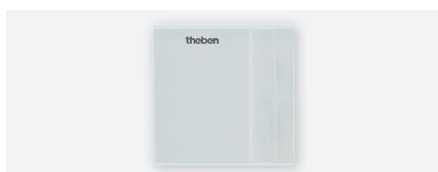
907.0.459, sonde de température IP65