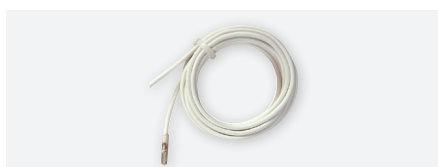
907.0.321, capteur de température sol