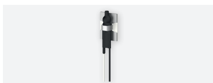
907.0.496, sonde de température encastrée