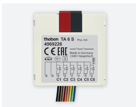
TA6 S KNX