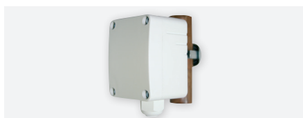
907.0.489, capteur de température en applique dans un boîtier à couvercle rabattable pour mesurer la température sur des tuyaux et des surfaces bombées