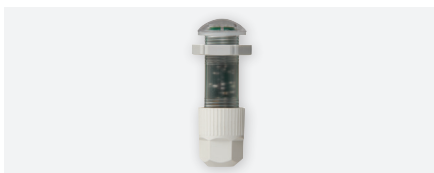
907.0.456, lichtsensor (inbouwmontage)