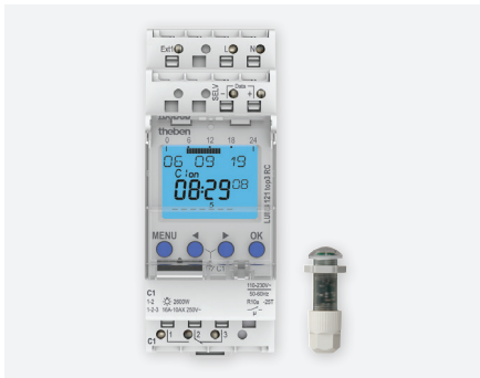
LUNA 121 TOP3 RC EL