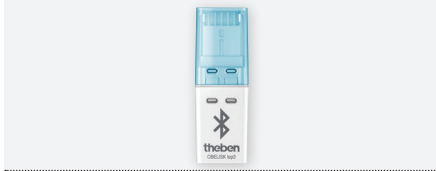
OBELISK top3 , steekbaar geheugen Obelisk top3