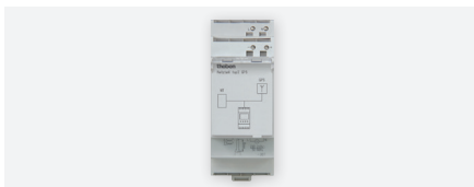
907.0.892, voeding voor GPS-antenne