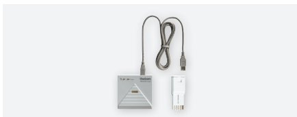
907.0.409, Obelisk programmeerset