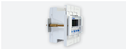
907.0.001, kit voor inbouwmontage