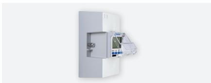
907.0.064 (CB-TR2), klemmendeksel