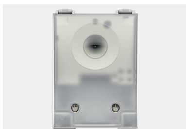
LUNA 127 star S