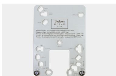
907.0.486, plaat voor wandmontage