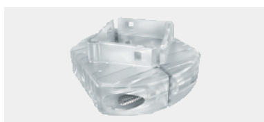
907.0.928, adapter voor mastbevestiging