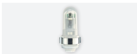
907.0.415, lichtsensor (opbouwmontage)