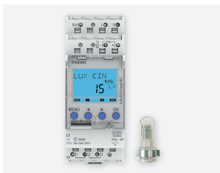
LUNA 111 TOP3 AL