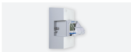
907.0.064 (CB-TR2), klemmendeksel