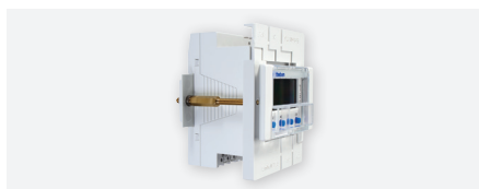
907.0.001, kit voor inbouwmontage