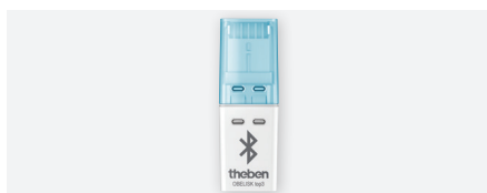
OBELISK top3, steekbaar geheugen Obelisk top3