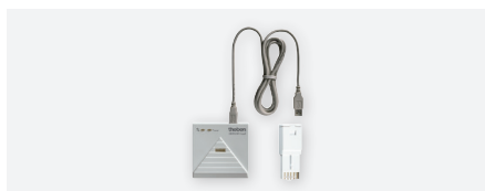
907.0.409, Obelisk programmeerset