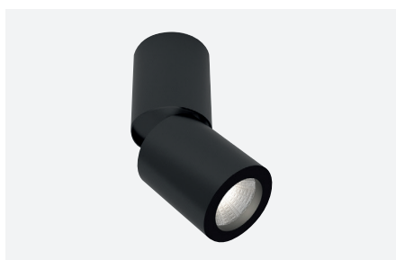
ID411801NSC (gestructureerd zwart)