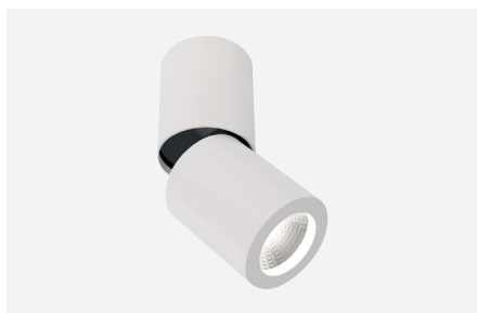
ID411800BSC (gestructureerd wit)