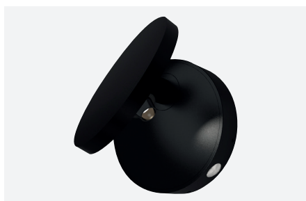
ID491033NSC (gestructureerd zwart)