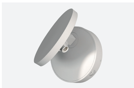
ID491030BSC (gestructureerd wit)