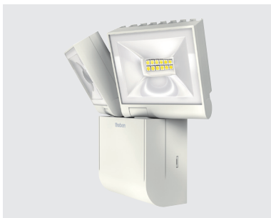
theLeda S20L WH