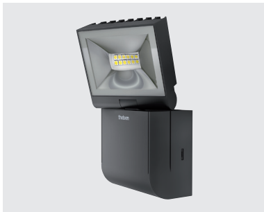
theLeda S10L BK