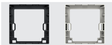
Cadre rehausseur à monter entre le socle et le détecteur pour le passage des câbles latéral ou supérieur