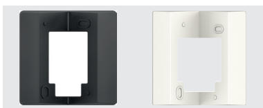
Support pour montage dans ou sur un angle de mur