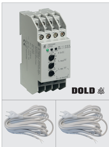
KIT IL RAIN