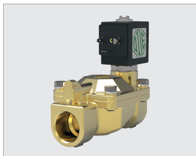
21W3KB190-BDA230AC-305 , électrovanne 2 voies 3/4", NF, 230 V AC, 8 W, NBR