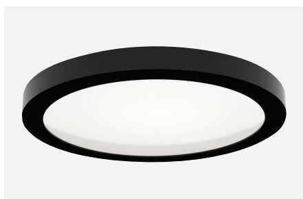
ID591018NSC (gestructureerd zwart - 2.700 K) ID591017NSC (gestructureerd zwart - 3.000 K)