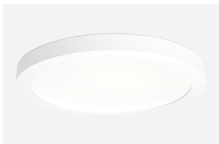
ID591007BSC (gestructureerd wit - 3.000 K) ID591008BSD (gestructureerd wit - 4.000 K)