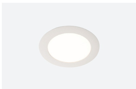
ID813021BEC (3.000 K - 14 W) ID813022BED (4.000 K - 14 W)