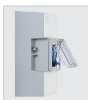
907.0.065 (CB-E8), set met klemmenafdekking