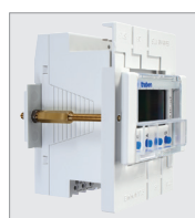
907.0.001, set voor inbouw- montage