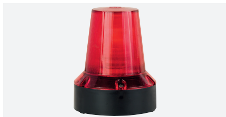
ACC SRL 230